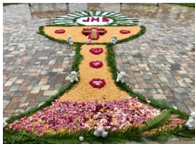
Berentzwiller : le samedi 13 juin, devant l'église St Imier.

Der Begriff Fronleichnam leitet sich vom mittelhochdeutschen : vrône licham "des Herren Leib" ab (vrôn = was den geistlichen oder weltlichen Herrn betrifft, licham = der Leib)