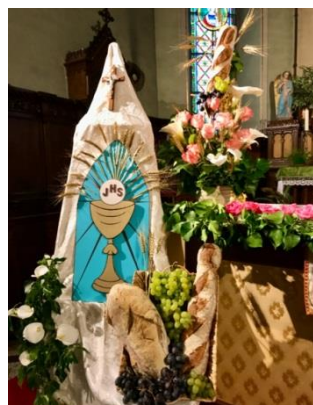
Obermorschwiller et Berentzwiller ont été privés de la procession, remplacée par une veillée d'adoration après les messes du 13 et 14 juin.